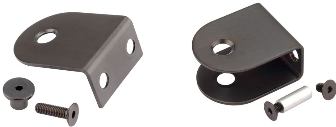
诺万五金制造（上海）有限公司 家具五金

1. 指示锁和拉手融为一体，精致而灵便，而铝合金具有优良的导电性、导热性和抗蚀性，也是隔断配件的推荐材质之一。④不锈钢系列：不锈钢配件是洗手间隔断系列产品里面运用**广的一款，常见的主要有201不锈钢、304不锈钢以及316不锈钢。201不锈钢材，具有一定的耐酸、耐碱性能，密度高、抛光无气泡、无***等特点，但201不锈钢含锰较高,表面容易生锈，耐腐蚀性能很差。对于做卫生间隔断很多人都会比较重视隔断的款式，隔断门的材质，而卫生间隔断配件也很重要。